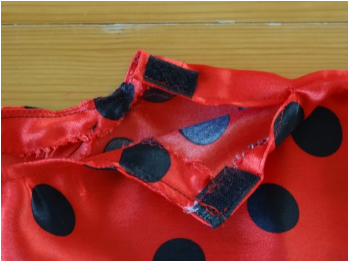
Faire un ourlet tout le long de la cape.